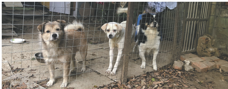
已被圈养的流浪狗。