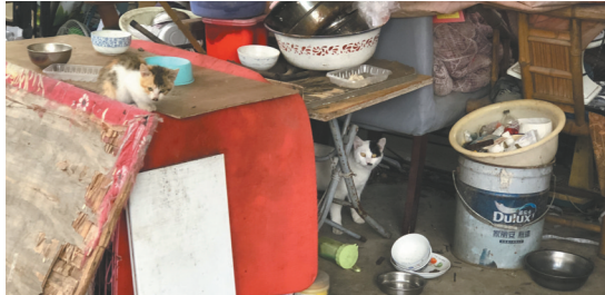
楼顶有近10个猫窝,并堆满杂物。