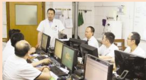
和同事进行病例研讨